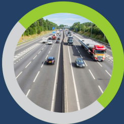
40-60 फीट रोड