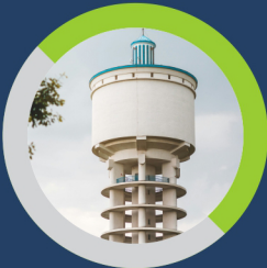
पानी की व्यवस्था