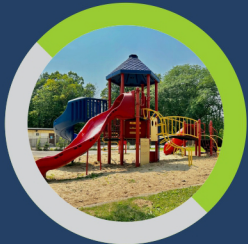
पार्क (ग्रीन एरिया)